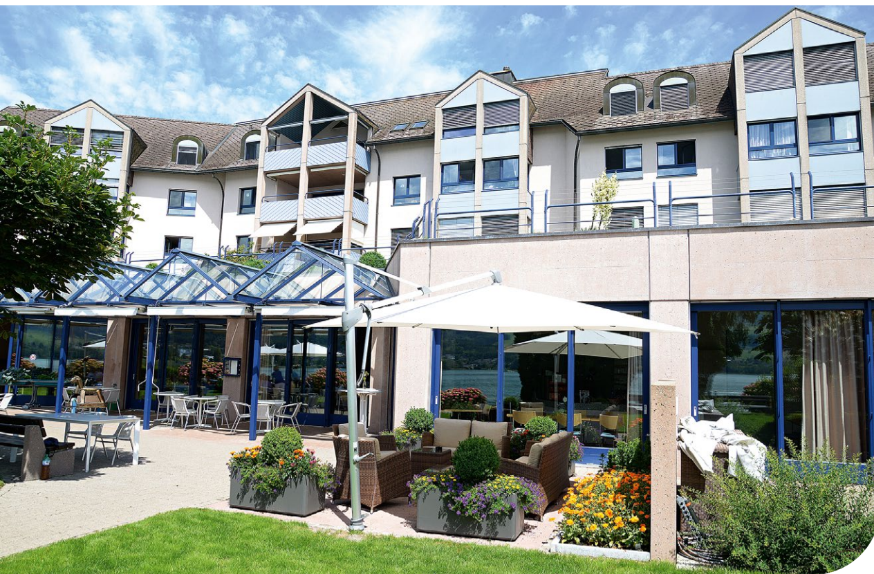
Heim & Hospiz St. Antonius.